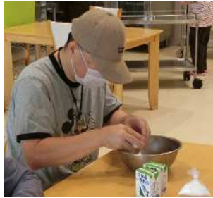
卵はそーっと慎重に割ります!

9月15日(金)にちゃれんじグループにてフレンチトーストを作りました。 ボールに入った卵液に食パンを浸し、ホットプレートで焼き、生クリームと チョコソースでそれぞれ思い思いにトッピングされました。 上手くトッピングが出来ない方は職員が手を添え共に実施し、トッピングを工 夫された方はケーキの様な出来栄えになっておられました。