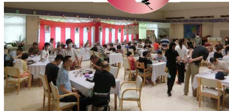
みんなでワイワイ、美味しいお食事ですね