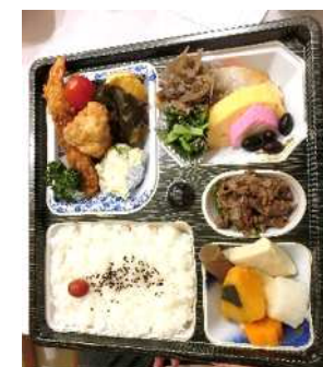
豪華なお弁当です♪