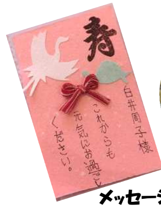
メッセージカードを渡しています(〇)