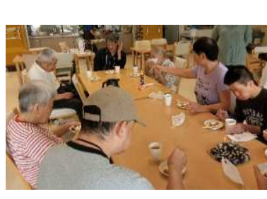
美味しいと大好評でした★