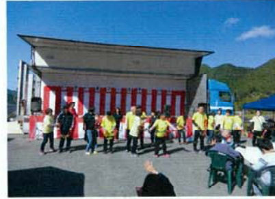
地域との親睦を深める為毎年みつみいきいきフェスティバルを開催