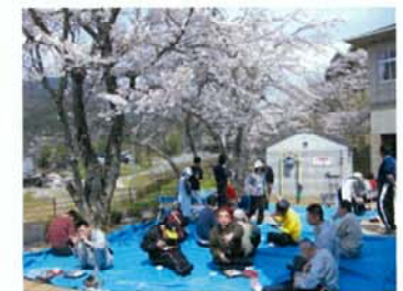
桜の下でお花見(余暇支援)