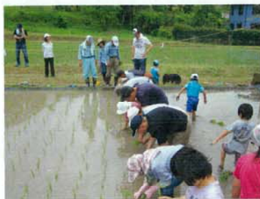
地域への行事には積極的に参加【地域お田植え祭】

この施設入所サービスでの利用者支援については、個別支援計画に基づいた住居生活における全般的なサービス・援助を提供します。また、休日には地域生活活動に参加できる機会を多くとりながら、障害の程度にかかわらず個々の特性に合ったサービスを展開しています。