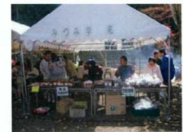
各イベントでの販売活動