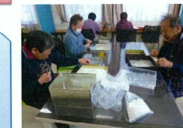
みらい館での作業風景

就労の機会を提供するとともに、生産活動その他の活動の機会の提供を通じて、知識や能力の向上のために必要な支援を行います。生活の場所から少し離れた場所に2ヶ所作業場(みらい館・そらいろ)を設け、そちらを拠点に生産活動を行っています。