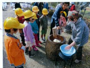
地元小学校との交流会(餅つき)