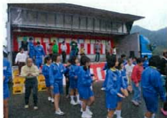
校区内の中学生のボランティア受け入れ

地域においても多くの人たちにお世話になり、地元小・中学校の福祉教育の場・学生の施設実習の場としても広く利用されています。