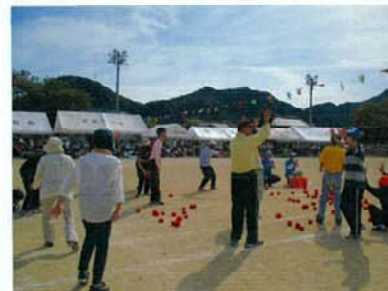
地域の運動会に参加