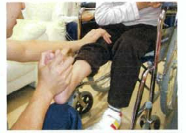
理学療法士によるリハビリ訓練の様子